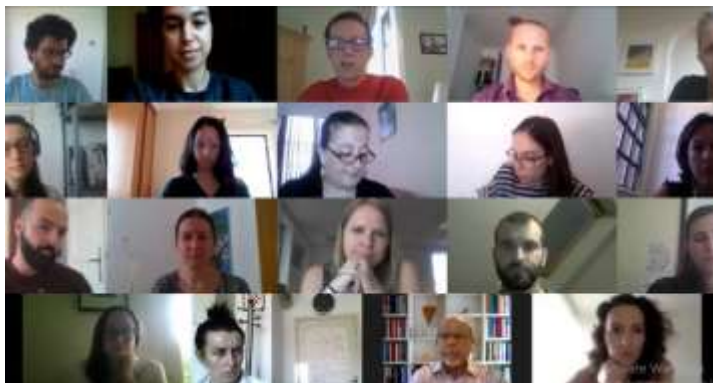
ENS konferencija, 2020

01.03.2020. PGP je potpisao partnerski sporazum s Europskom mrežom za bezdržavljanstvo (European Network on Statelessness – ENS) , u vrijednosti 1,500 €. PGP provodi aktivnosti vezane za prevenciju i smanjenje slučajeva bezdržavljanstva u RH. Projekt je trebao trajati do kraja 2020., no radi pandemije COVID-19, produžen je do 30.06.2021. Projekt obuhvaća samo dio aktivnosti koje PGP provodi u suradnji s ENS-om.