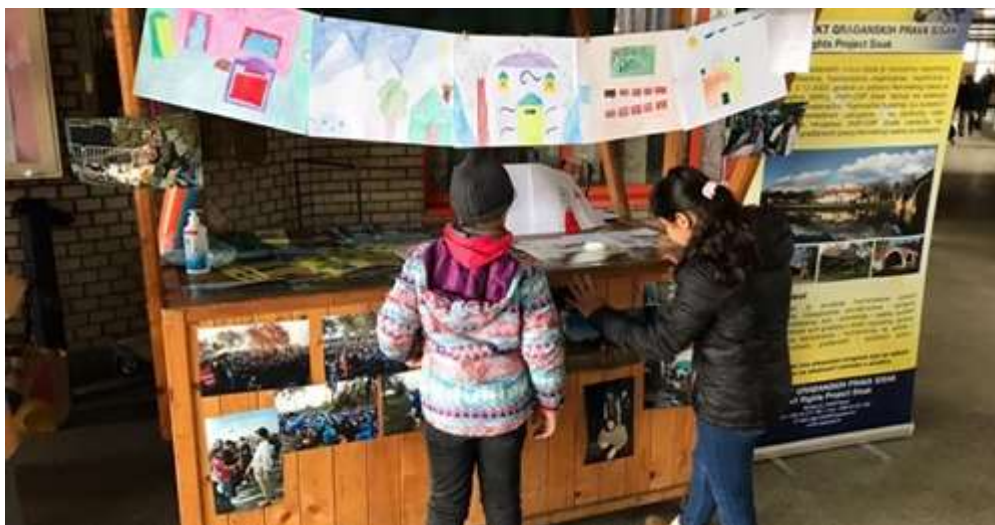
13.11.2020. Svjetski dan tolerancije obilježen na sisačkoj tržnici.

Treba istaknuti da smo radili i na drugim aktivnostima, npr. uključili smo se u aktivnosti Partnerstva za zapošljavanje SMŽ, nastavili smo suradnju s Uredom za probaciju u Sisku, itd. Osim toga PGP je nastavio suradnju s organizacijama civilnog društva u RH, ali i u susjednim državama, a nastavljena je i dobra suradnja s jedinicama lokalne samouprave na području Sisačko-moslavačke i Karlovačke županije.