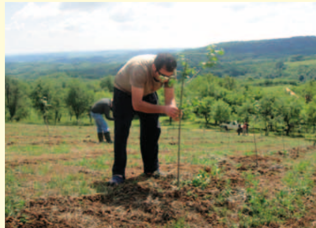
Europe in my farm – Europa na mom imanju

Kroz pet radionica koje se planiraju održati proizvođači će se informirati o standardima proizvodnje u EU te mogućnostima financiranja iz strukturnih fondova